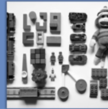
HAUPT aus STELLUNG