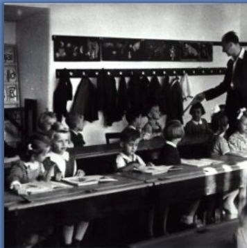
SCHULE anno Dazumal