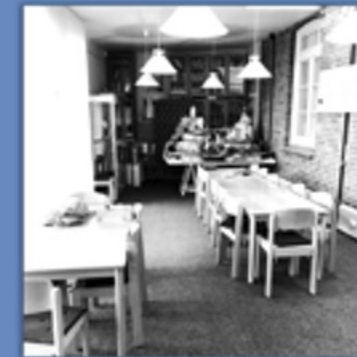
unser seminar Raum