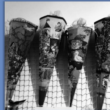
SONDERaus STELLUNGS Raum