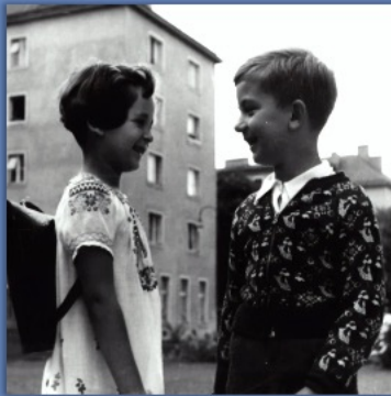
TYPISCH MÄDCHEN/ JUNGE